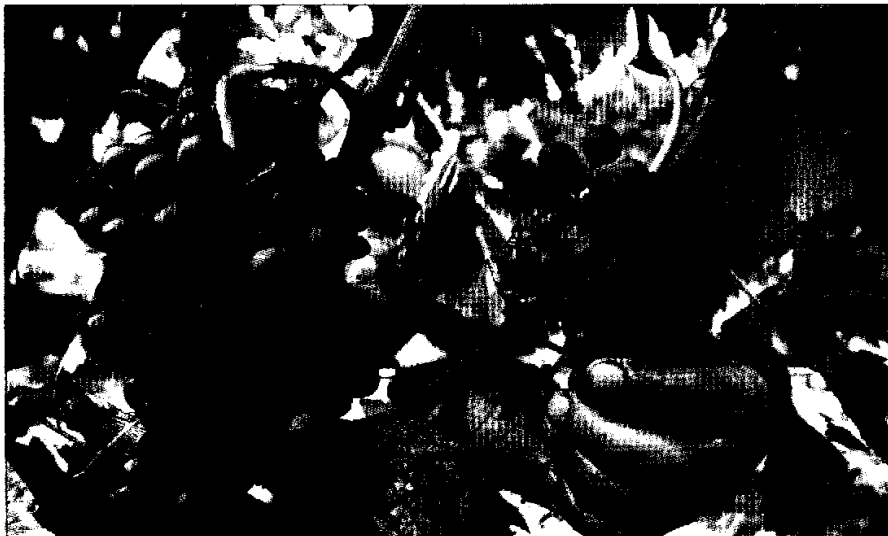
Los viñedos de Francia, en la imagen, serán un punto incluido en 'La vuelta al mundo en 80 viñedos'. EL BOLETÍN

Los fondos recaudados de esta subasta estarán destinados en su totalidad a una asociación humanitaria, Acción Contra el Hambre. Empresas como JF Hillebrand (especialista de logística) o Dharma Wines (importador) ya se han apuntado para ayudar al cumplimiento de esta gran operación humanitaria que se podrá seguir cada mes a partir del mes de febrero 2007.